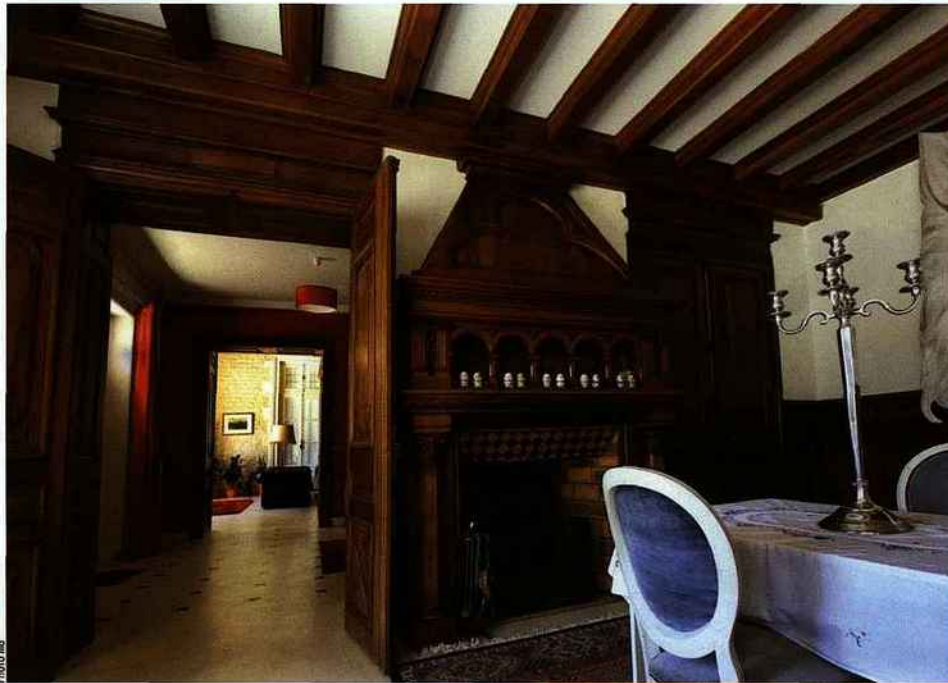
Les boiseries intérieures en noyer confèrent à l'ensemble du rez-de-chaussée style et convivialité.