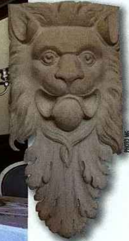
Les lions de la cheminée du grand salon veillent sur les hôtes des lieux.